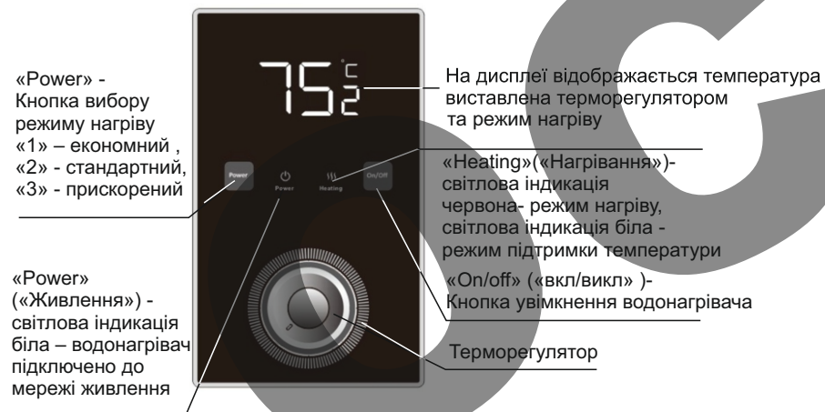
Мал.1- Панель керування

На панелі керування розташований дисплей, який показує поточну температуру води та режим нагріву.